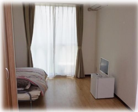
さわやかライフ愛子居室

宿泊型自立訓練の卒業者に優先的に入居していただいています。利用期限はありません。月～土に朝・夕2食提供しています。