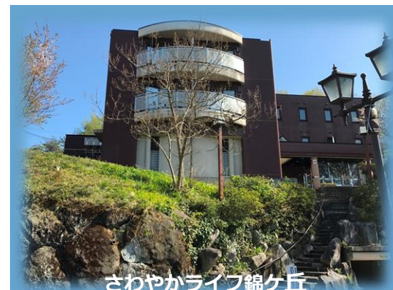
さわやかライフ錦ケ丘