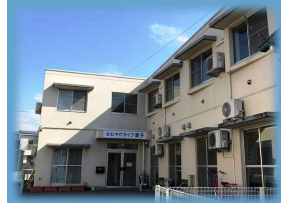
さわやかライフ愛子